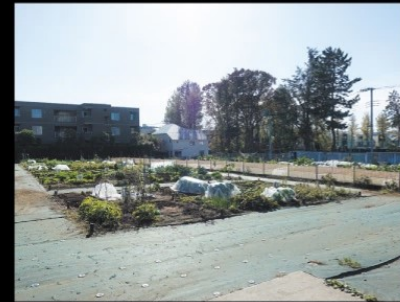
目の前に広がる区民農園