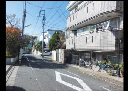
前面道路(周辺環境)

東急バス「東深沢小学校」バス停徒歩3分 (東急コーチ) 自由が丘駅～駒大深沢キャンパス前 【目07系統】 目黒駅～都立大学駅北口～弦巻営業所 【都立01系統】 都立大学駅北口～桜新町駅～成城学園前駅南口