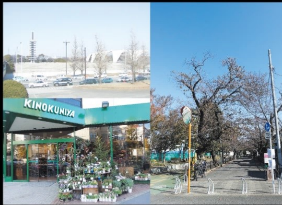
周辺(駒沢公園・紀ノ国屋・呑川本流緑道)